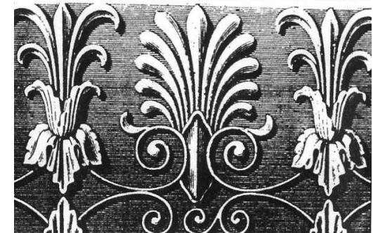
Die Palmette - Schinkels Lieblings-Ornament zu seinem Grab auf dem Dorotheenstädtischen Friedhof